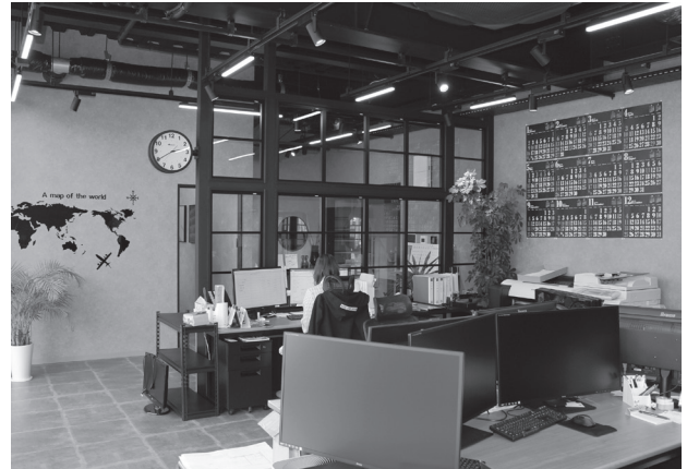
2021年2月に完成した新社屋

先ほども申しましたように、経営の信条は枠に捉われる事なく「断らないこと」です。そのためには経験や知識・多岐にわたる人脈が重要となってきます。実現するための可能性や方法をまず考える。さらには要望以上のご提案ができるよう一